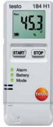
testo 184 H1