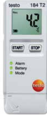
testo 184 T2