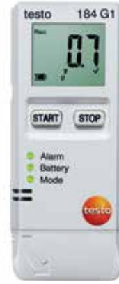
testo 184 G1