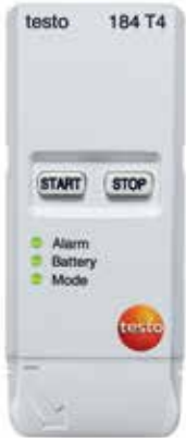
testo 184 T4