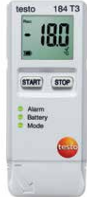
testo 184 T3